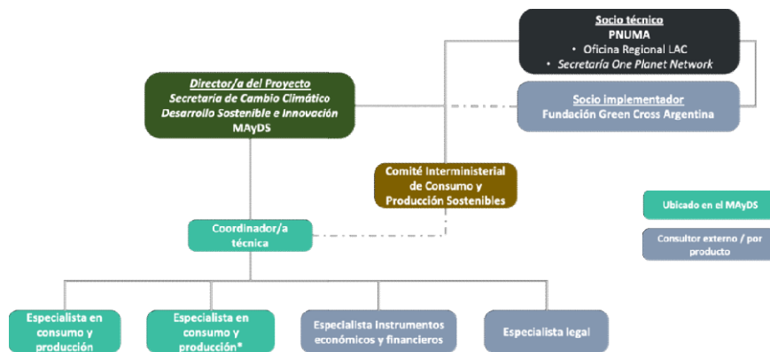
Figura 2: Estructura de trabajo del proyecto.

Con el propósito de garantizar la implementación eficiente de todas las actividades del proyecto, se ha definido la siguiente estructura de trabajo: