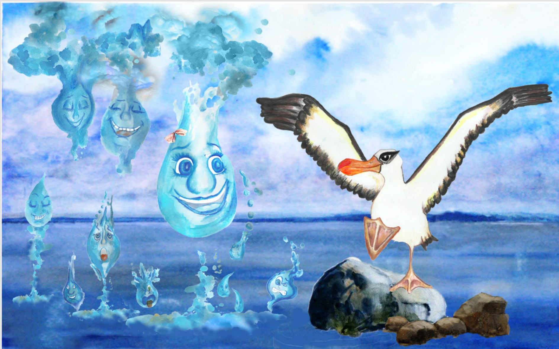
Escena " Primera Estación del viaje: la Evaporación"